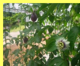
パッションフルーツ